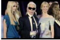
Model, Muse und dreifache Mutter